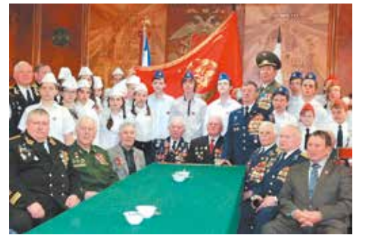
Начальник Главного штаба ВВПОД «ЮНАРМИЯ», олимпийский чемпион Д. Труненок

Впереди – громаднейший объём работы, решение стратегических задач по развитию движения. И поэтому крайне важно помочь им с юных лет выбрать правильные, верные ориентиры, содействовать определению жизненного выбора. В чем мы ждем помощи и от ветеранов Вооружённых Сил.